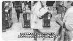
「交通のバリアフリー」 (2016年)