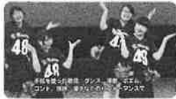
鳥取県 第3回手話パフォーマンス甲子園 (2016年)