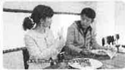
「たからあやのぼろ酔いカフェ」 (2016年)