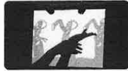
千葉聴覚障害者センター 「彫絵手話 浦島太郎」(2016年)