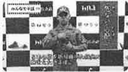
三重県伊勢市 みんなで手話動画