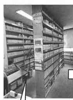
これまでの2階のDVDおよびビデオ展示エリア