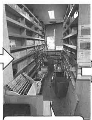
7月末より棚からDVDおよびビデオの撤去作業開始