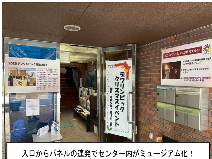
入口からパネルの連発でセンター内がミュージアム化!