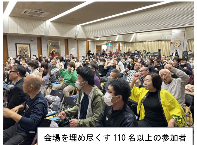
会場を埋め尽くす110名以上の参加者