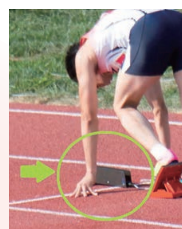
陸上競技のスタートランプ