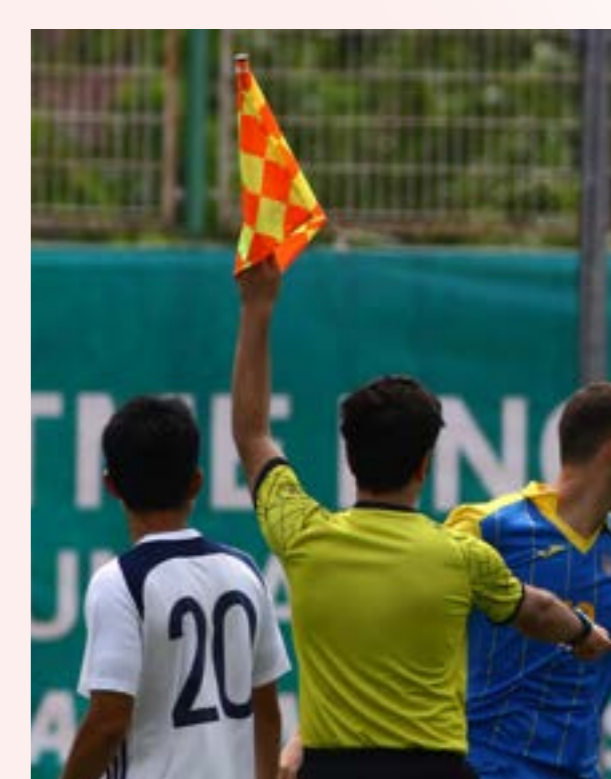
サッカー競技では主審もフラッグを