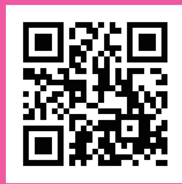
東京2025デフリンピック 大会ポータルサイト